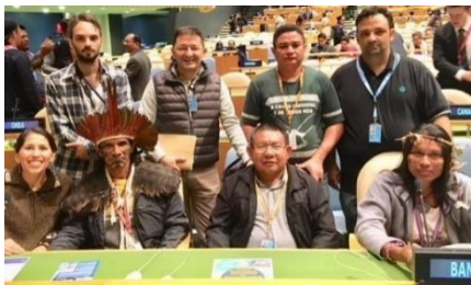
Apenas alguns traços rápidos:

As UN acolheram o 18º Forum Permanente sobre Questões Indígenas (UNPFII) , de 22 de Abril a 3 de Maio. O Tema deste UNPFII de 2019 foi: “Conhecimento Tradicional: geração, transmissão, proteção” . Juntou representantes de milhares de comunidades indígenas vindas de todo o mundo que falaram da importância de proteger as suas terras, língua e cultura e o perigo de as perder. As populações indígenas ressentem fortemente a pobreza, dado que são apenas 6% da população global, mas 15% dos pobres do mundo. Os seus territórios e o seu sustento são muitas vezes ameaçados pelos mega projetos que prometem lucros financeiros aos Governos mas não respeitam os direitos dos seus bens comuns.